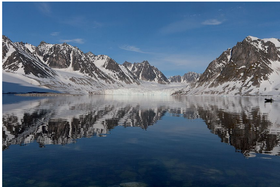
6.6.3: Fin sommerdag sent i juni i indre Magdalenefjorden, med Waggonwaybreen i midten.