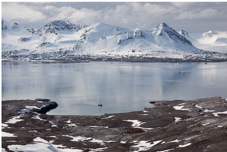
6.4.3-3: Peirsonhamna på Blomstrandhalvøya med den gamle marmorgruven London. Brøggerhalvøy med Ny-Ålesund i bakgrunnen. Midten av juni.