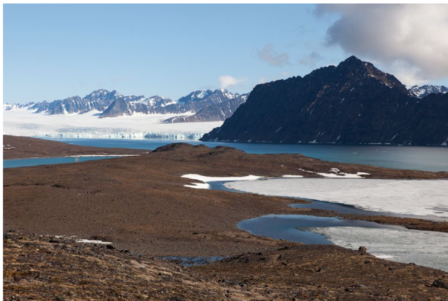
6.5-1: Landskap med innsjøer (til høyre), bukt (til venstre) og fjord (i mellomgrunnen). Signehamna i Krossfjorden. Lilliehöökfjella i bakgrunnen.