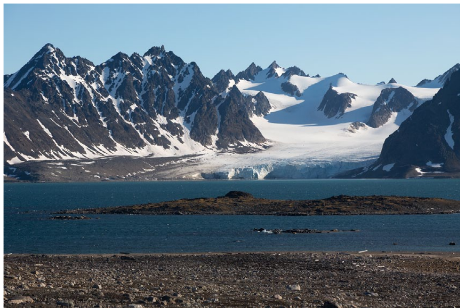
6.7.1-1: Smeerenburgfjorden med Frambreen, sett fra Danskøya.